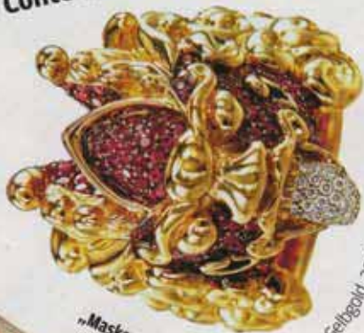
„Maskenring“ von Georg Hornemann. Gelbgold, 30 Diamanten, 189 Rubine, 12.400 €

Contenance, Mesdames! Siems Luckwaldt stellt lässige Saisonbegleiter vor