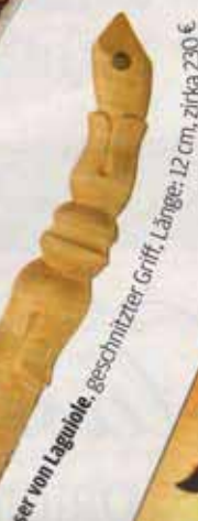
Wurmer von Lagiole, geschmützter Griff, Länge: 12 cm, zirka 230 €

CO FILCO WWW.DUNHILL COM HERMÈS WWW HORNEMANN WWW LAGIOLE ÜBER FISCHWA 040/30 38 22 LAP PHILIP K