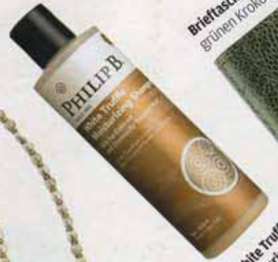
„White Traffic“ Moisturizing Shampoo von Philip B. mit Trüffelöl und 23,2% reinen Pflanzenextrakten