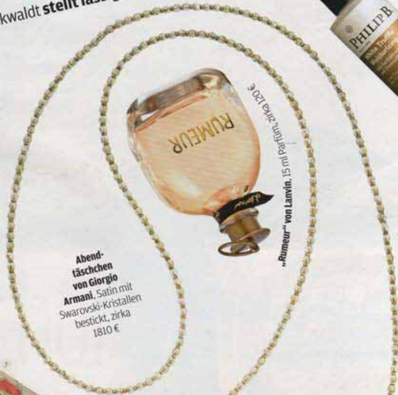
Abendfäschchen von Giorgio Armani. Satin mit Swarovski-Kristallen bestickt, zirka 1810 €