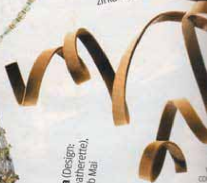
Leder-sandale von Hermès aus Kalbsnubuk, zirka 400 €