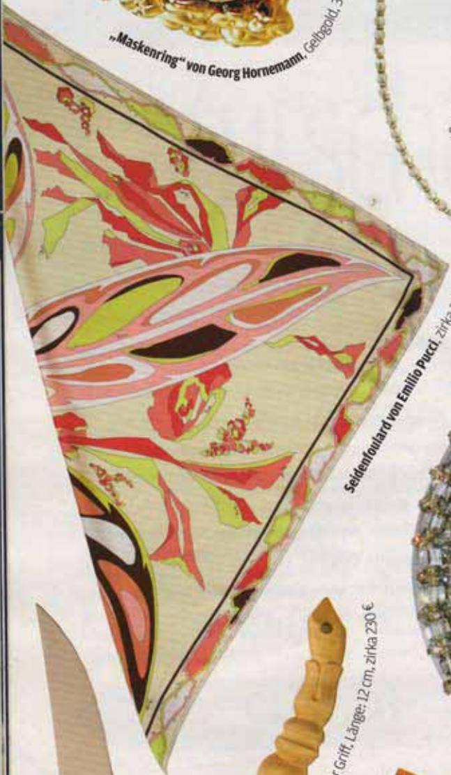
Seidenfoulard von Emilio Pucci, zirka 200 €