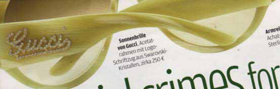
Sonnenbrille von Gucci. Acetatrahmen mit Logo-Schriftzug aus Swarovski-Kristallen, zirka 250 €