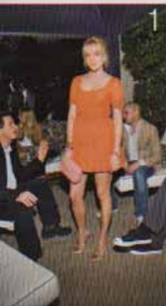
1 Schöne Christa Davy („Vib“, „Lust“) sagt, heute ist es was für ein Trend ist 2 Augenbrauen : Die die Prominente der HBO-Serie „Big Love“ hat Fernsehproduzent Bill & Melinda Whitely Schöne in einem Video blog gepostet

Philip B. ist in dieser Nacht noch lange wach. Er hat eine Idee für ein neues Beauty-Produkt und will den Prototyp unbedingt anhand zusammenschreiben. In seiner Küche, mitten im letzten Wald Hollywood, machen er den Schinken und Schlangengarten.