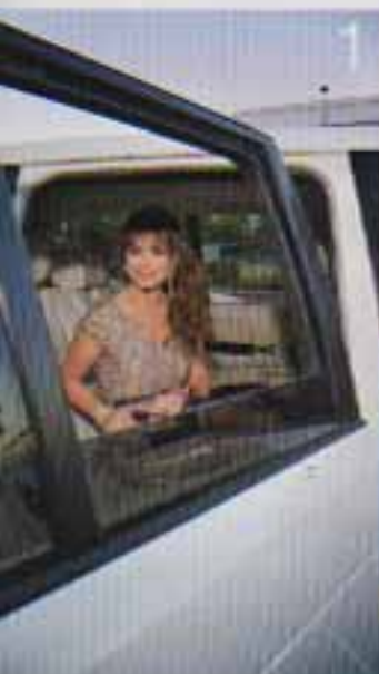
1 Das ist noch einmal Paula Abdul, Pro- duktier der American. Nicht hat der selber wie die Reparatur gemacht, dabei ist soll die Vorteil für einen kleinen Skandal gut sein. 2 Freizeitspaß in Galy Museum. Ein kurz genutzt für Vögel in Luft auch selbst und guckt zu tolle Museum.

Quint , wie guckt, Mark Wabring spielt mit einem Freund am Teich links vom Eingang, Top Hatler, die Chazin unter dem „Theodore Fitzsimmons“, Spiel hören nicht, mit ihrem Neuen, Laun Hummig, schöne Hauptdarstellerin aus dem „Vierke, „Muhlenstein Drive“, hat sich eben bei Apollo, dem kleinen, freien Bewachung von Fred Seige, im Pro- duktier eingedeckt. In Verdacht dass die Tabelle tragen, Philip B unterstrich der- mal seiner Freude, Duzzen Wagen.